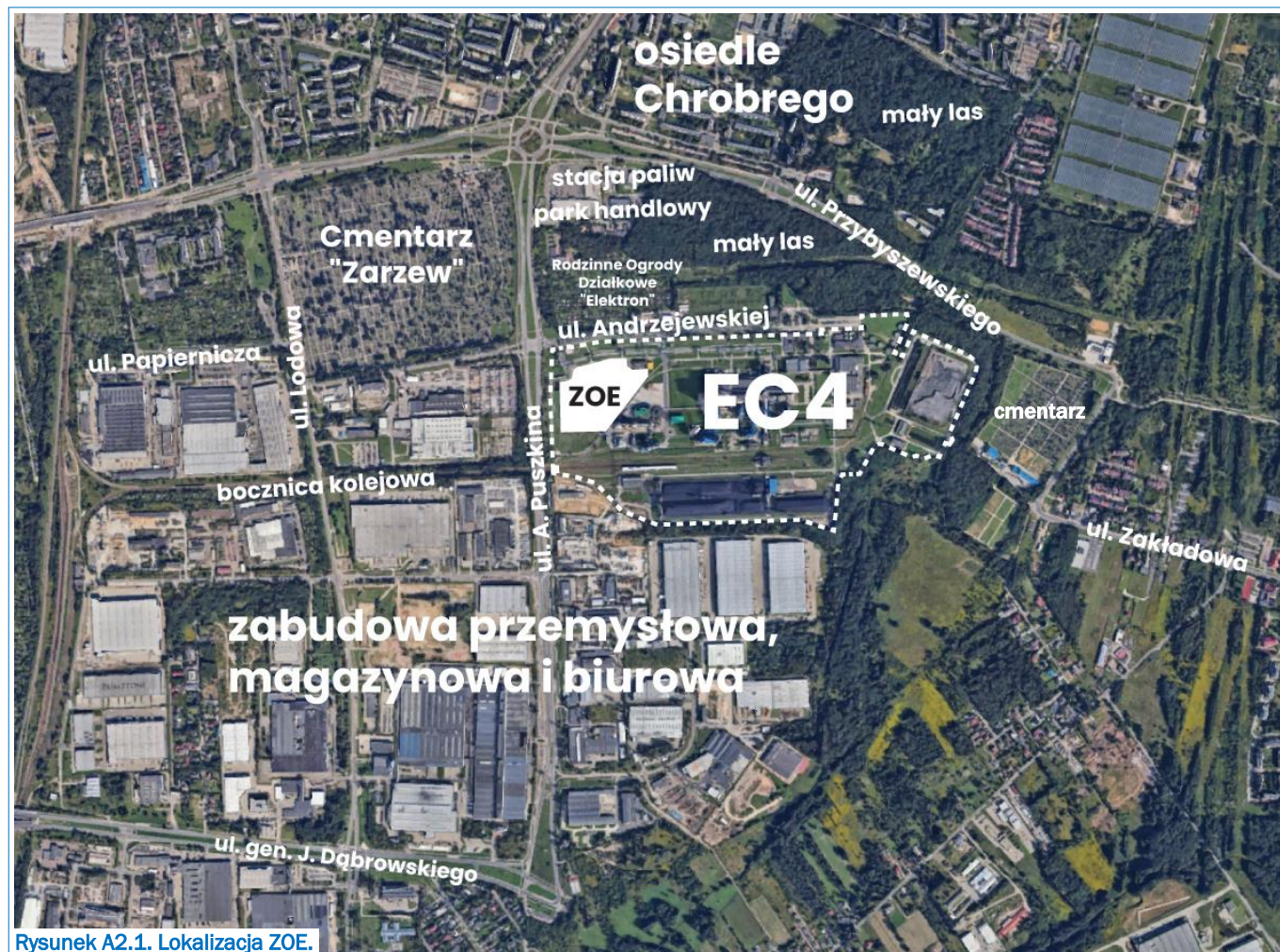
Rysunek A2.1. Lokalizacja ZOE.

Zgodnie z polityką przestrzenną ustaloną w Studium uwarunkowań i kierunków zagospodarowania przestrzennego miasta Łodzi 1 ZOE położone jest na terenach przeznaczonych pod zabudowę, w strefie ogólnomiejskiej oznaczonej symbolem