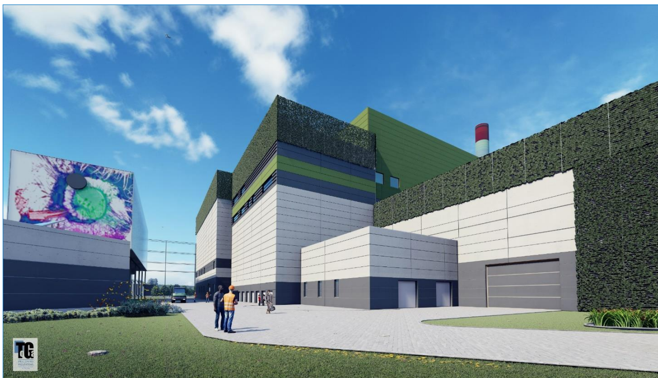
Rysunek A2.3. Wizualizacja ZOE.

Rozpoczęcie etapu budowy jest planowane na 1 kwartał 2025 r. Budowa potrwa ok. 3,5 roku. Uzyskanie pozwolenia na użytkowanie i rozpoczęcie etapu eksploatacji są planowane na 3 kwartał 2028 r. ZOE będzie eksploatowany długoterminowo i obecnie nie jest znany termin jego hipotetycznej likwidacji.